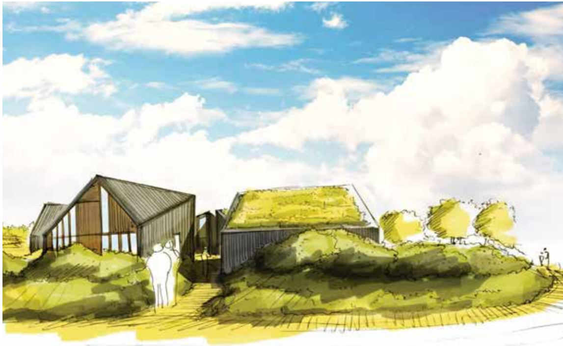
Situatieschets van park Noordersandt