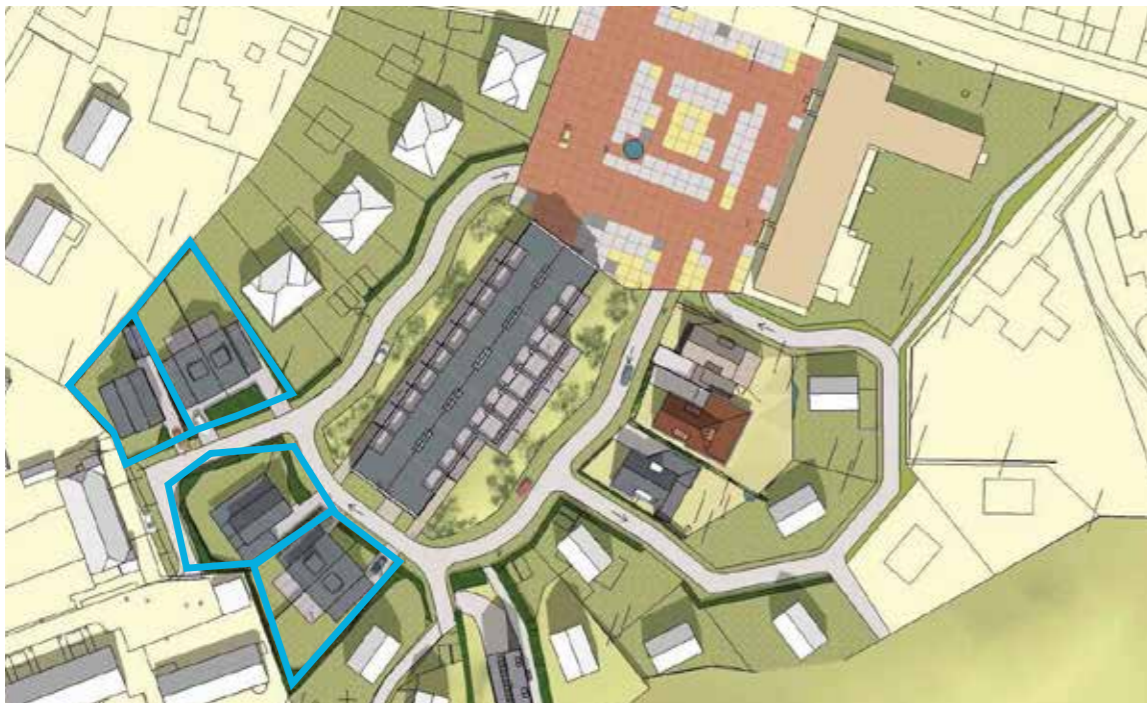
Situatieschets verkaveling van het OS&O terrein