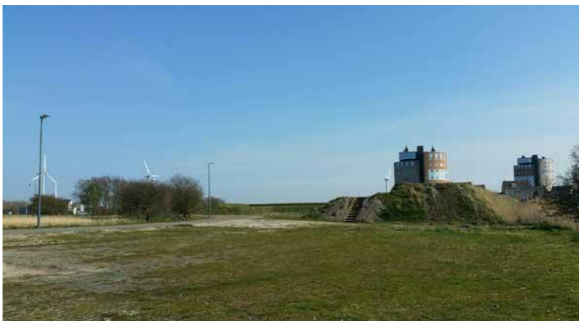
Aarden wal Fort Westoever