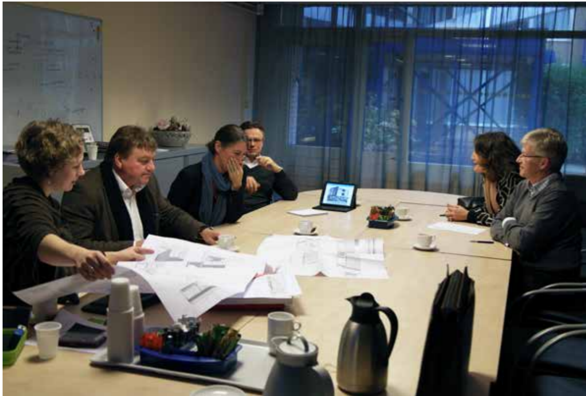
CRK in vergadering