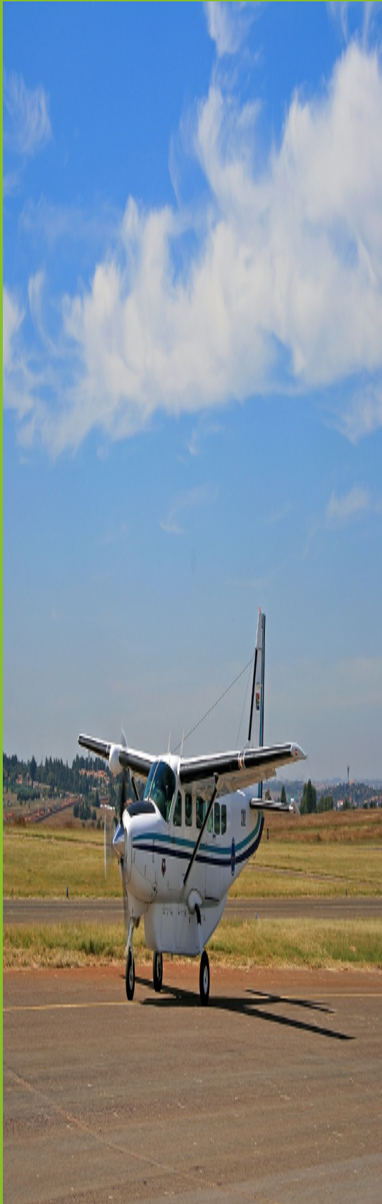
Viermaal per jaar vliegen ze drie uur lang