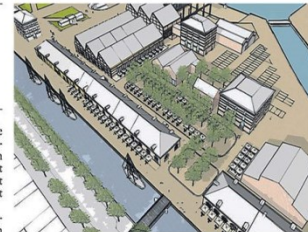
Een impressie van het nieuwe uitgaansgebied op Willemsoord. ILLUSTRATIE P&A

Levendig, veilig en gezellig horecaplein