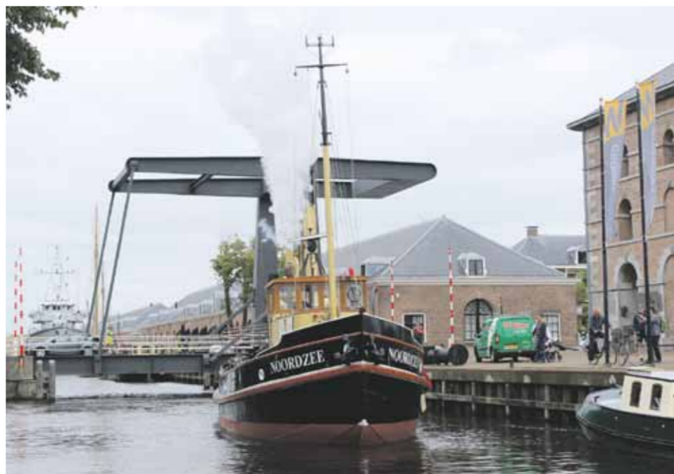
De Noordzee bij het stoempompgebouw op het Willemsoordcomplex.

Op donderdag 8 augustus 2019 maakte de Noordzee haar echte maidentrip. Reisdooel was haar voormalige thuishaven Medemblik, waar zou worden deelgenomen aan de manifestatie Westfriese Waterweken. Na het opstoken met GTL als brandstof werd van de museumhaven naar de Koopvaardersschutsluis gevaren. Daar werd overgeschakeld op kolenstook. Met de stroom mee kon op de Waddenzee een snelheid van bijna 10 knopen worden gehaald. Via de sluis in Den Oever ging het over het IJsselmeer richting Medemblik, waar de Noordzee halverwege de middag het havenhoofd passeerde. Deze binnenkomst trok opmerkelijk veel belangstelling. Hierna kreeg de Noordzee gezelschap van andere schepen