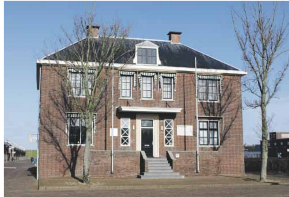
'Het Raadhuis', een oud gebouw uit de Rijkswerf-tijd. Momenteel zetelt Zeestad in dit statige gebouw.

In het begin van deze eeuw besloot gemeente Den Helder te starten met stadsvernieuwing. In die tijd waren bij het rijk en de provincie vele potjes waar geld in zat voor stadsvernieuwing. De provincie had toen geen goed gevoel over de gemeentelijke organisatie en de gemeenteraad van Den Helder.