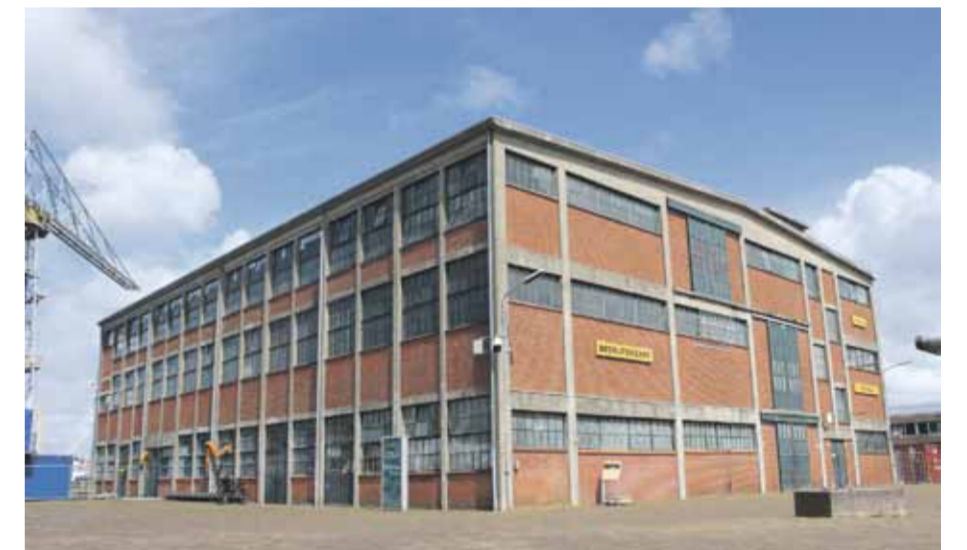
Misbruik monumentaal Gebouw 72 Willemsoord niet als stadhuis. maar breng het terug in zijn oude glorie.