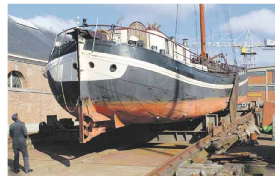
De klipperaak Hollandia heeft als 75-ste schip drooggestaan op de helling. Vanwege geluidsoverlast voor de ambtenaren kan deze straks niet meer worden gebruikt.