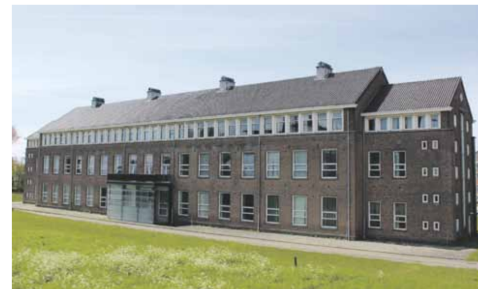
Een goed alternatief kan dit al jaren leegstaande gebouw achter de Nieuwediepkade zijn.