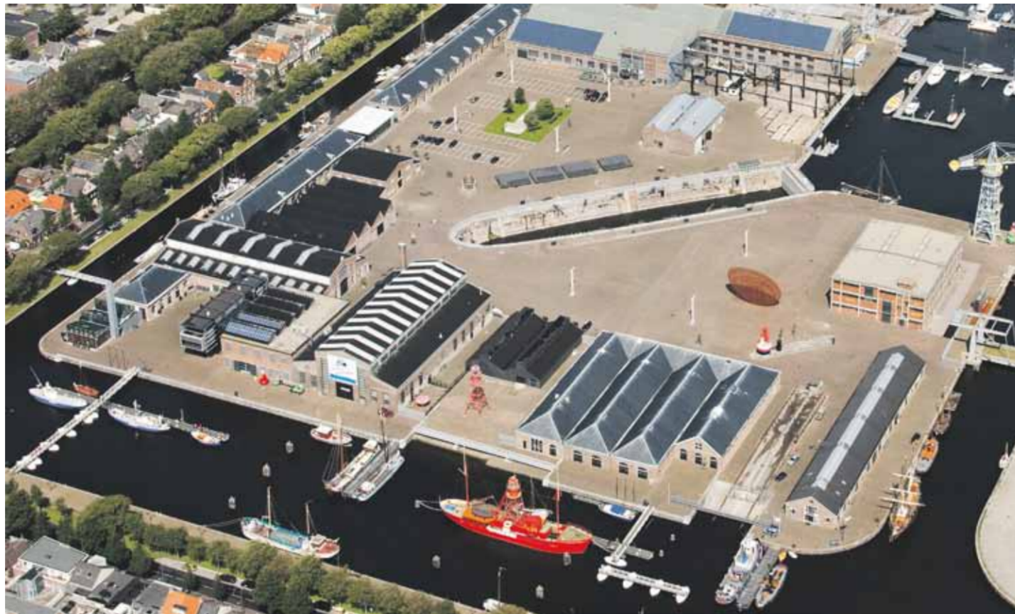
Luchtfoto van het Nautisch Kwartier met museumhaven op en rond het Willemsoordcomplex.

ligers en fondsen te werven, wat de eerste jaren best een moeizaam proces bleek te zijn.