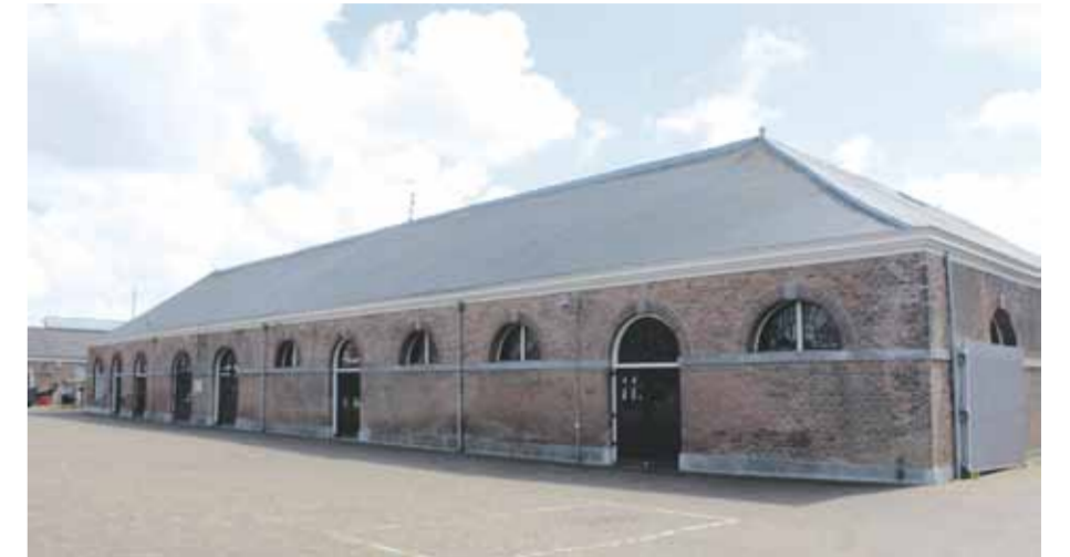
Misbruik monumentaal Gebouw 66 Willemsoord niet als stadhuis maar breng het terug in zijn oude glorie.