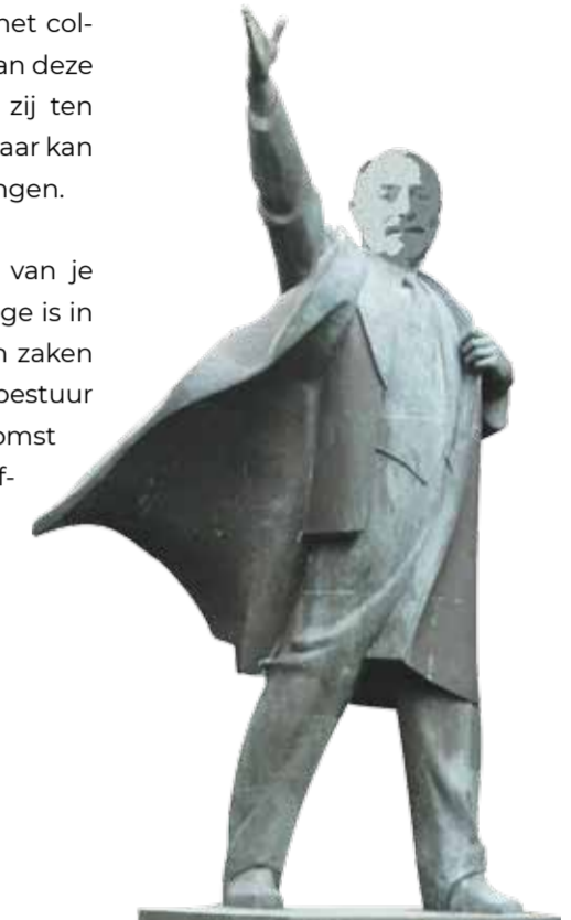
Het 'Woutertje' Zou je in Den Helder een standbeeld krijgen voor wat je niet hebt bereikt?

Trek nog maar een blik 'gebakken lucht' open!