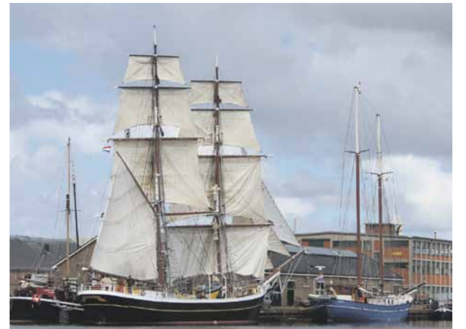
Schepen aan de belangrijke afbouw- c.q. reparatiekade die straks verloren gaat.

Succesvol zijn ook de evenementen die regelmatig in het Nautisch Kwartier worden georganiseerd. Heel bijzonder was bijvoorbeeld de viering van het 40-jarig jubileum van Het Historisch Bedrijfsvaartuig in augustus 2014. De leden van deze grootste behoudsorganisatie voor varend erfgoed kwamen massaal naar Den Helder. Hierdoor waren er dagenlang in totaal zo'n 170 bijzondere schepen in de museumhaven en langs de Flaneerkade te bewonderen. In 2016 werd op het Willemsoordcomplex de eerste editie van de Traditionele Schepen Beurs gehouden. Een jaarlijks terugkerend nautisch evenement dat circa 3.000 bezoekers uit binnen- en buitenland trekt. En vanaf 2019 werd het eerste Dutch Wood-