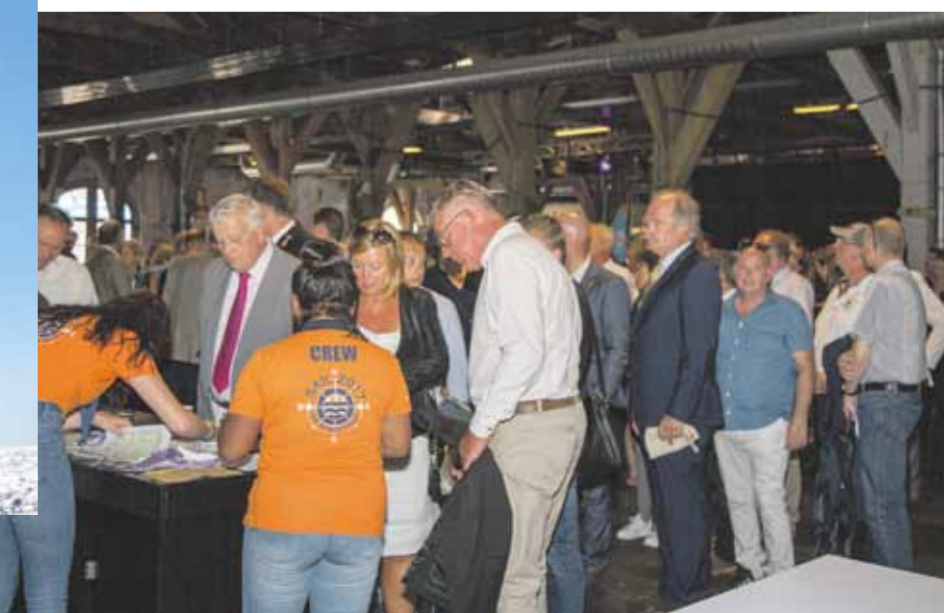
Tijdens Sail 2017 op dag 1 inschepen aan boord van o.a. de Morgenster.