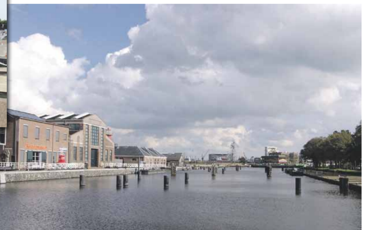
Dit wordt ons vooruitzicht. Een compleet lege museumhaven. Willen we dat echt?