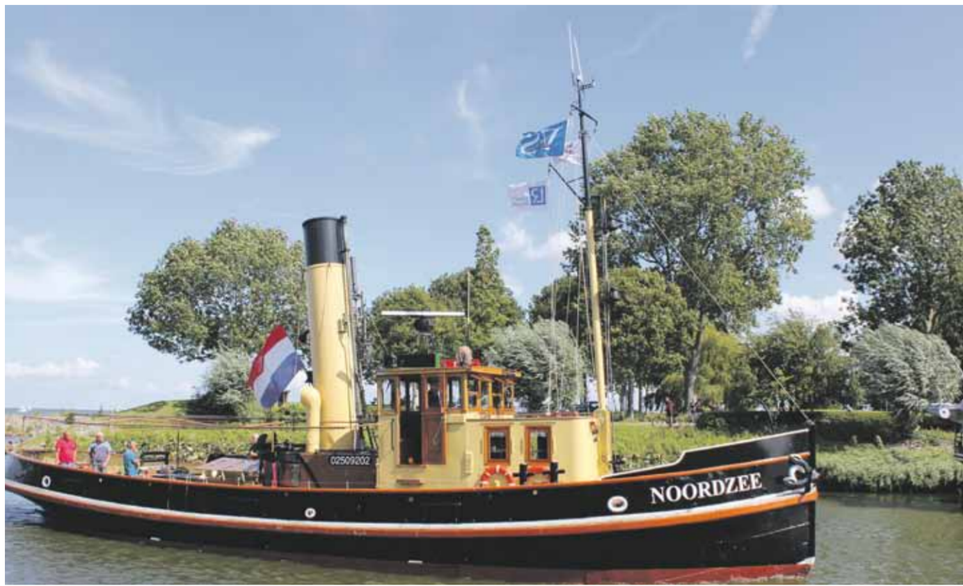
Op haar maidentrip is Medemblik aangedaan.

In Museumhaven Willemsoord kan eigenlijk niemand de heel toepasselijke voor restaurant Stoom afgemeerde Noordzee over het hoofd zien. Lange tijd had het echter niet veel gescheeld of deze unieke stoomsleeperboot was gesloopt. Gelukkig kon dit laatste worden voorkomen en vervolgens zag in Den Helder een groep enthousiaste vrijwilligers in vier jaar tijd kans de bijna 100 jaar oude stoomsleeper weer in haar oude glorie te herstellen. Absoluut een hoogstandje, waarmee weer eens is aangetoond waartoe vrijwilligers met hulp van bedrijven en steun van fondsen en donateurs in staat zijn.