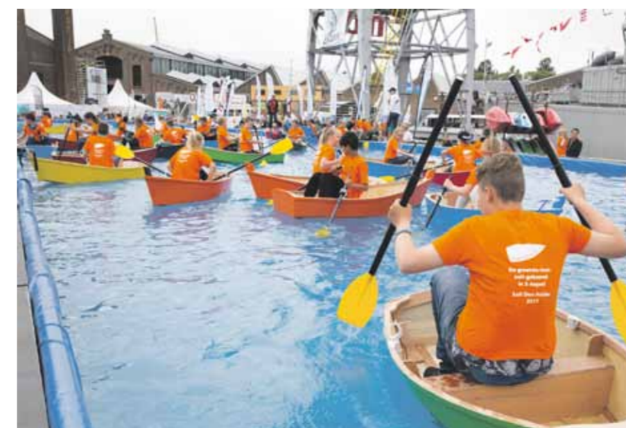
Jeugdvermaak - je kunt je afvragen of dit in de toekomst nog wel mogelijk is?