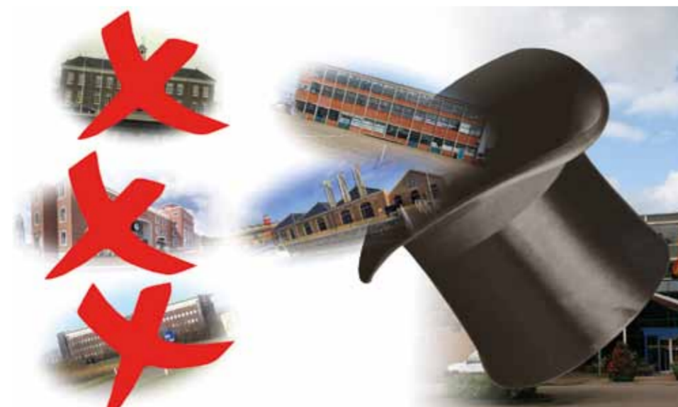
Het ene na het andere idee wordt 'spontaan' uit de hoge hoed getoverd.

Het liep allemaal anders. De verkiezingen van 2018 waren geweest. Geen van de politieke partijen had in hun verkiezingsprogramma iets over het gemeentehuis staan. Dat was ook logisch want de verbouw van het gemeentehuis was eigenlijk rond. Opeens kwam uit de hoge hoed van de nieuwe coalitie het idee om het gemeentehuis te verplaatsen naar Willemsoord.