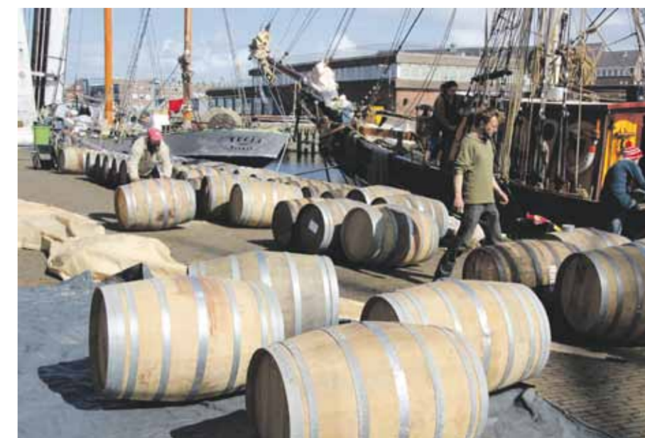
Wordt dit het nieuwe (pauze) vertier van de ambtenaren?

In mijn geheugen staat de eerste private investering in het nautische gebied Willemsoord (door iemand die de Helderse politiek vertrouwde): het 'Cape Holland attractiepark'. Het begon zo voortvarend, maar de politiek wist het beter en bestemde het attractiegebied als vrij toegankelijk wandel- en parkgebied! Het mapark werd daarmee vakkundig de nek omgedraaid en de verantwoordelijke realiseerden zich pas later dat zo'n aanpassing zelfs attractiepark de Efteling in een faillissement zou drijven. De politiek speelt blijkbaar vaak ondernemertje, zonder echt de pijn te voelen bij een mislukking. Misschien dat een hoofdelijke aansprakelijkheid voor een deel van de mislukkingen, een hulpmiddel kan worden om het lichtzinnig inzetten van publieke gelden af te remmen.