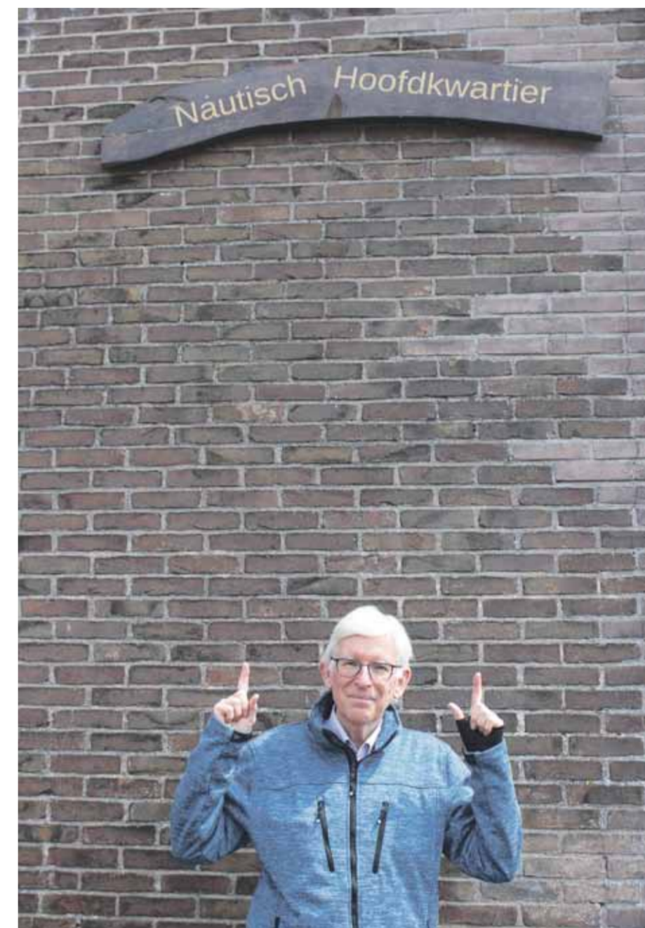
SBCE-voorzitter wijst op het naambord op de zijgevel van Gebouw 73, het enige echte Nautisch Hoofdkwartier op Willemsoord.

De naamskeuze voor het nieuwe stadhuis is dus eigenlijk een farce, bedacht door Zeestad en de Gemeente Den Helder om de burgers te doen geloven dat het nieuwe stadhuis naadloos opgaat in het kloppend hart van het Nautisch Kwartier met museumhavens. Alleen laten de inwoners van onze stad zich niet voor de gek houden en heeft deze misleidende naam veel wenkbrauwen laten fronsen. En ook is hiermee het vertrouwen in de lokale overheid nog