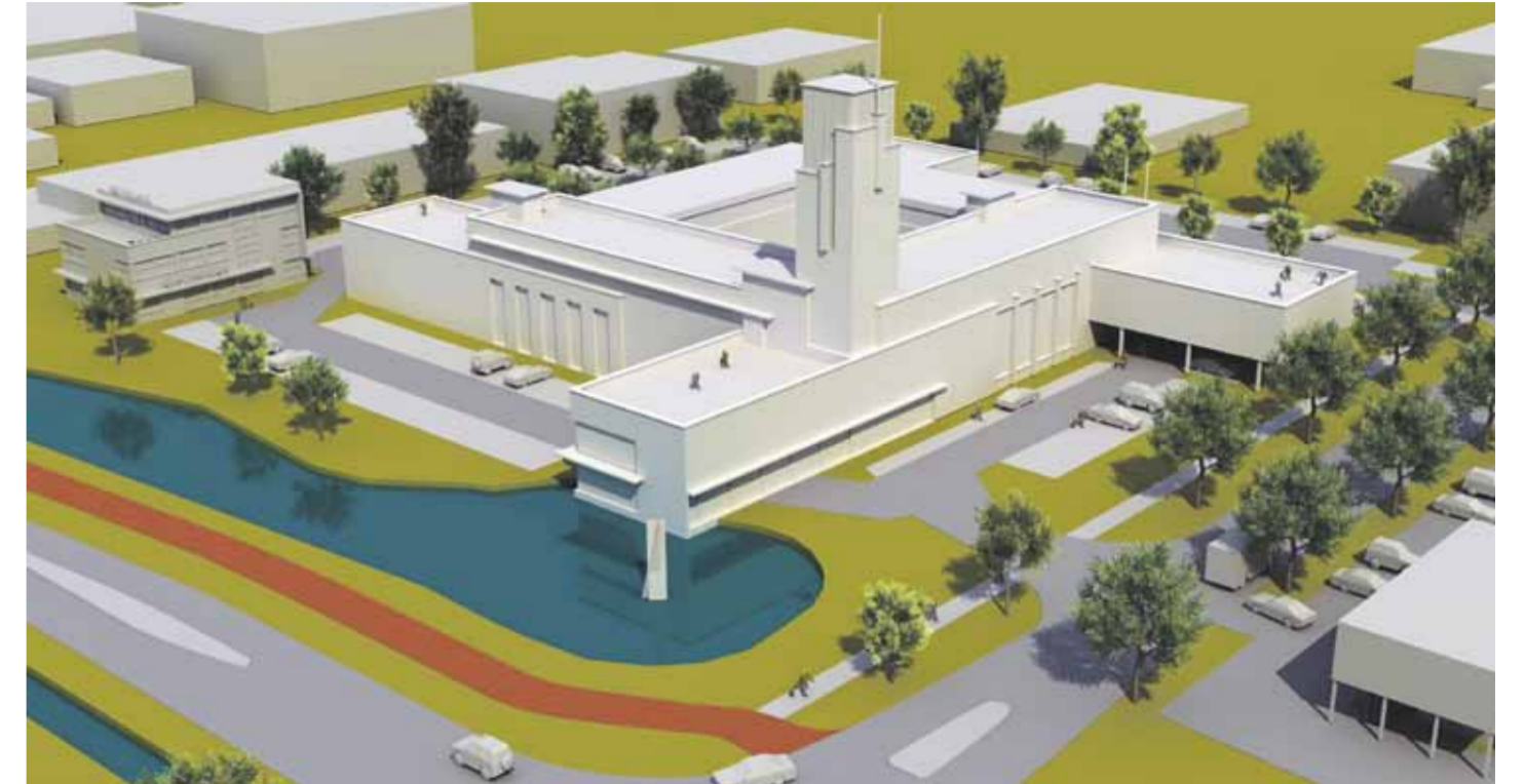
Het eerste alternatief is al in september 2019 gepresenteerd.

Het eerste voorstel betrof een prachtig en stijlvol ontworpen kantoorgebouw dat op steenworp afstand van het oude stadhuis aan de Bijlweg had kunnen worden gerealiseerd. Op een met het openbaar vervoer goed bereikbare plek aan de zuidkant van Den Helder. Met voldoende parkeer- ruimte en een prachtig open uitzicht. Bijzonder was dat dit markante gebouw, inclusief aankoop grond en bouwrijp maken, voor circa 13 miljoen euro gerealiseerd had kunnen worden. Dus voor de helft van de kosten van het stadhuisplan op Willemsoord. De SBCE oogstte voor dit plan