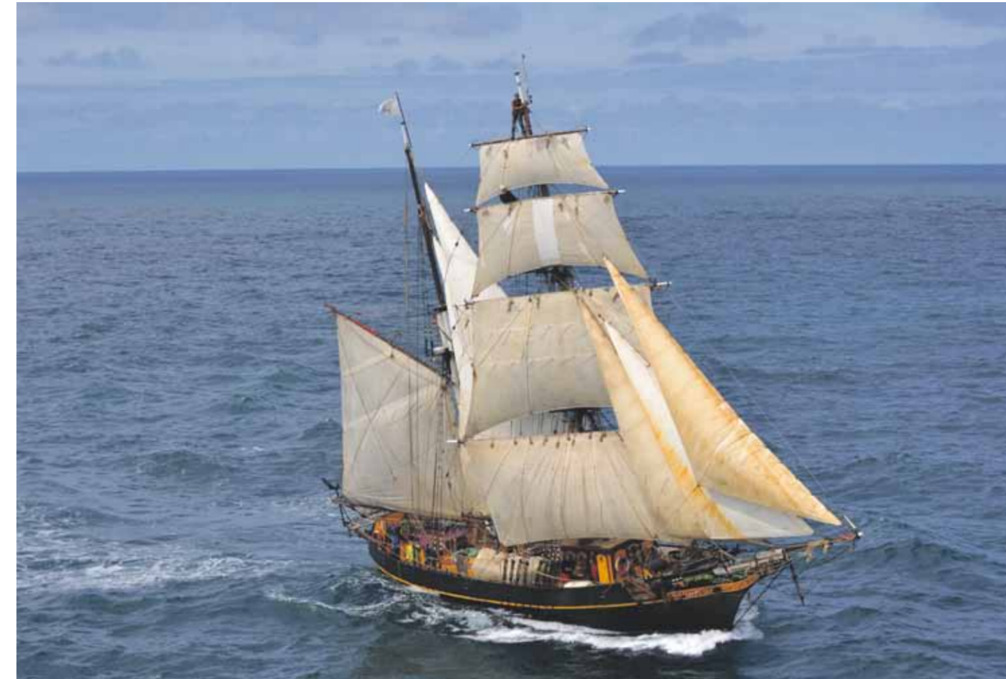
De motorloze brigantijn Tres Hombres transporteert duurzame producten tussen Zuid-, Midden- en Noord-Amerika en Europa.