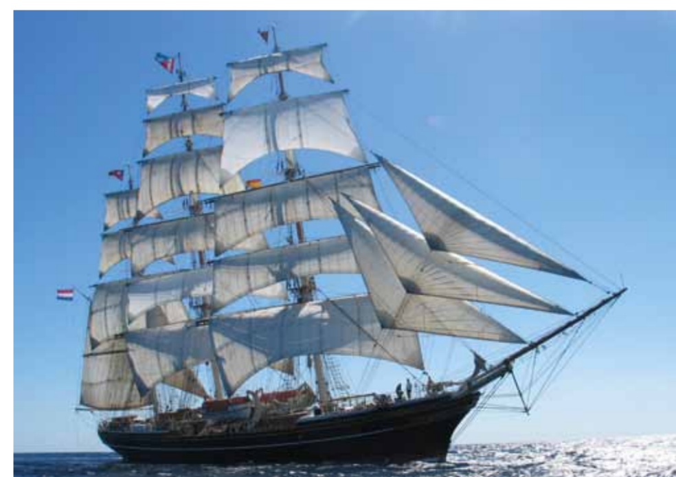
Clipper Stad Amsterdam.