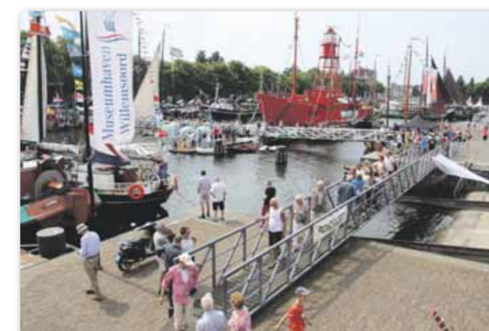
Volop aanloop in een goed gevulde haven. Dit is wat de mensen willen!